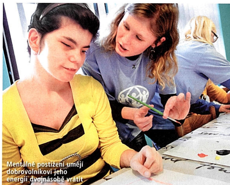
Mentálně postižení umějí dobrovolníkovi jeho energii dvojnásobně vrátit