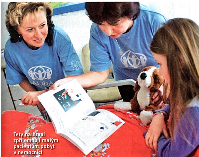
Tety na hraní zpříjemňují malým pacientům pobyt v nemocnici