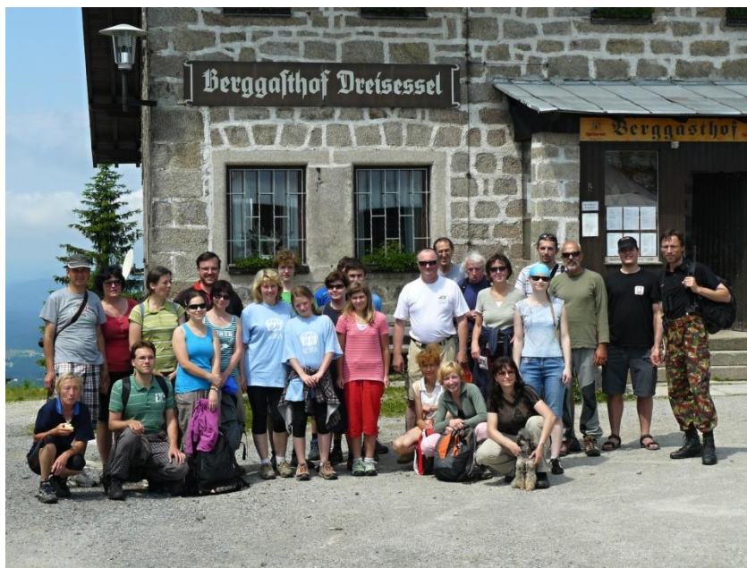
Letní pohoda na Šumavě