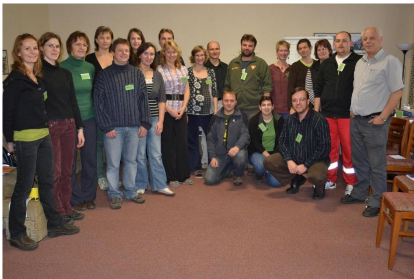
Účastníci výcviku českobudějovického KIP týmu