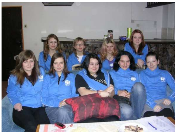
Foto: Dobrovolnice 4. skupina z Třeboňe.

Zhodnocení: Supervize se zúčastnilo celkem 10 dobrovolnic.