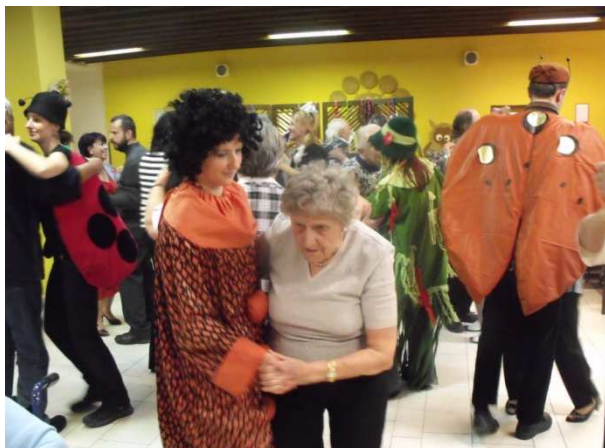
FOTO: DOBROVOLNÍCI PŘI TANCOVÁNÍ BĚHEM MASOPUSTU V DPS HVÍZDAL.