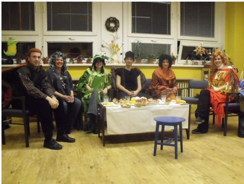
Foto: Dobrovolníci při Masopustu v DpS Hvízdal.