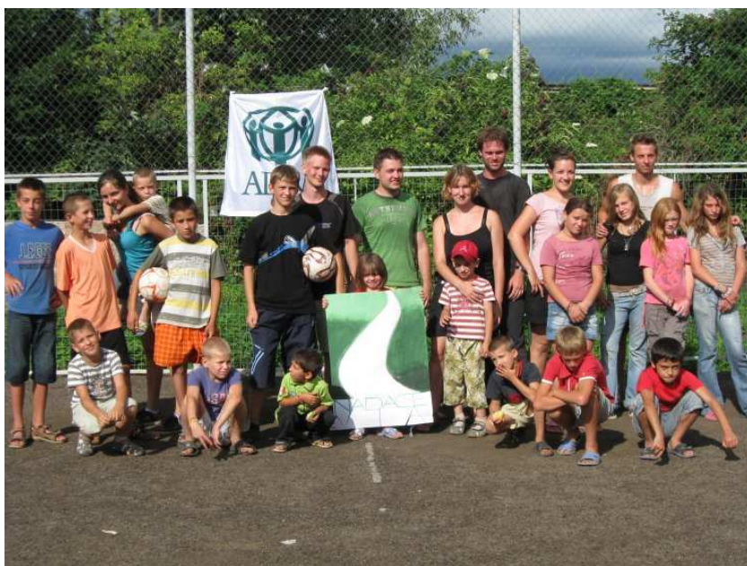
Foto: Děti z Mukačeva.

O jejich prožitcích se více dozvíte v příštím čísle.