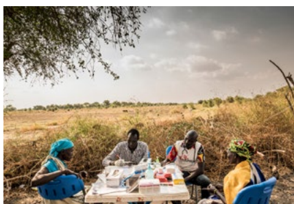
Taková normální ordinace