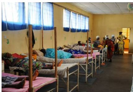
Nemocnice v Africe