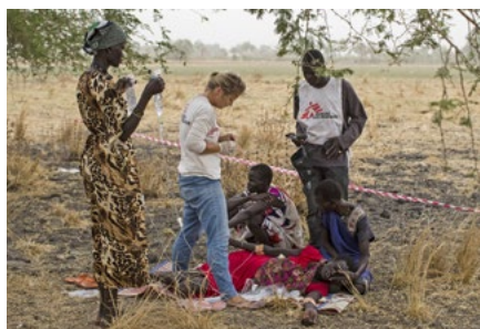
Na místě nezáleží