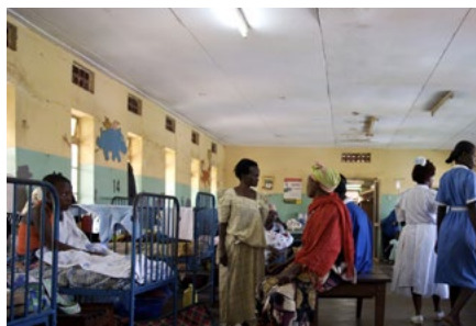
Nemocnice v Africe

Všechny fotografie naleznete ke stažení zde .