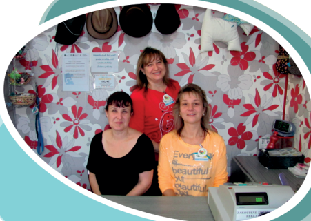
Charitativní obchůdek a Sociální šatník: Dlouhá třída 59a, Haviřov-Město, 736 01