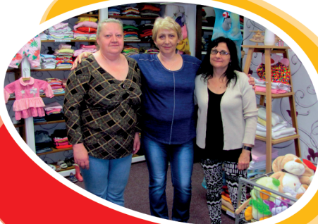
Charitativní obchůdek a Sociální šatník: Prameny 599/18, Karviná-Ráj, 734 01