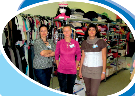
Charitativní obchůdek: SNP 8/808, Haviřov-Šumbark, 736 01