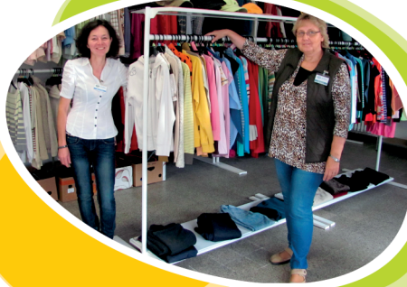
Charitativní obchůdek: Nám. Budovatelů 1408/6 Karviná-Nové Město, 734 01