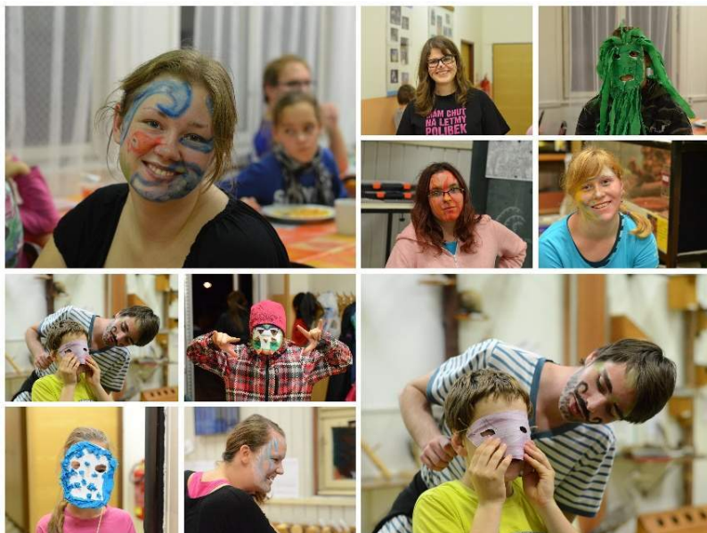
Společně si užíváme hlavně na víkendových pobytech

Vítaným doplňkem ke schůzkám dvojic jsou rovněž společné akce. Jak děti, tak dobrovolníci se mohou seznámit s ostatními účastníky programu, začlenit se do kolektivu a poznat svůj protějšek také v jiné situaci než je schůzka ve dvojici. To, že děti mají nablízku svého kamaráda – dobrovolníka, jim dodává pocit bezpečí a ti, kteří jsou jinak spíše nesmělí a zakřiknutí, nejednou bez strachu či ostychu navazují nové sociální kontakty. Jak je vidět z vložených fotografií, „naše“ děti, ač často mají problém, se kterým bychom si ani my z řad dospělých nevěděli rady, stále zůstávají především dětmi se vším, co k tomuto životnímu období patří – smích a „zdravé“ lumpárny jim rozhodně nejsou cizí.