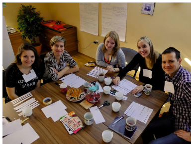
Pracovní skupinka a modelová situace na jarním výcviku

V roce 2015 jsme zrealizovali dva výcviky dobrovolníků, jeden na jaře (6. – 8. 3. 2015) a druhý na podzim (20. – 22. 11. 2015). První výcvik absolvovalo 5 dobrovolníků (mezi nimi jeden muž) a druhý výcvik 6 dobrovolníků.