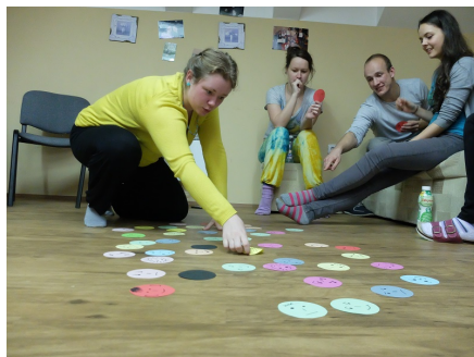
Úvodní seznamování a hodnotící část na podzimním výcviku