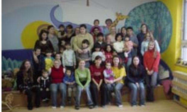
↑ Středoškolský dobrovolnický klub ADRA v Uprchlíckém táboře