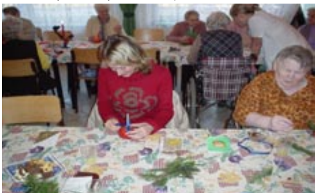
↑ Dobrovolníci v Domově důchodců ve Frýdku-Místku / Benefiční konc. skupiny Nezmařů