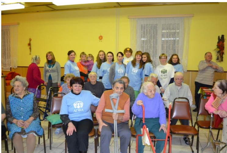
Dobrovolníci a uživatelé DS Třeboň.

Cíl akce: Materiální vybavenost zásahového týmu, aktivity při výjezdu – nácvik.